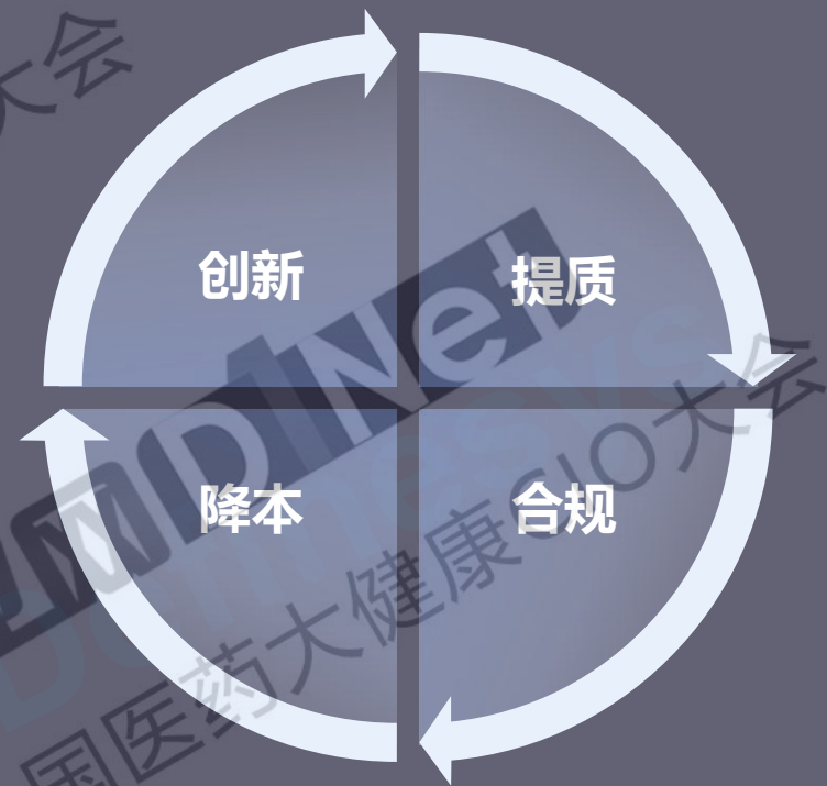
药企数字化转型主基调

通过互联网医疗、虚拟代表等数字化营销方式触达更多客户，通过线上业务闭环实现药品消费转化，为药企提供更广阔的增长空间。