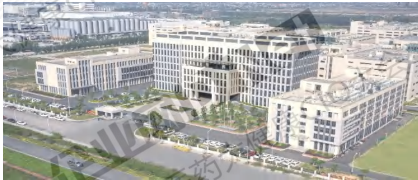
联瑞制药 智能生产基地