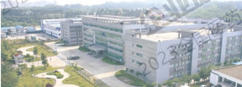
一品红制药 高标准生产基地